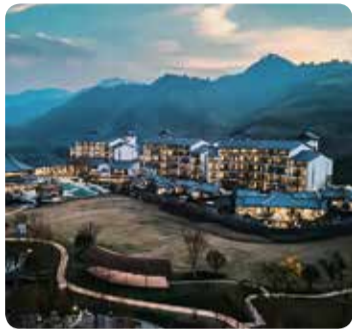
杭州天目山都喜天丽酒店

4A급 텐무산 자연 생태구에 자리 위치한 두짓타니 호텔은 산맥이 굽이굽이 펼쳐진 대자연 속에 어우러져 풍부한 대자연의 '음이운'을 뿜어낸다. 호텔의 전반적인 분위기는 중국식으로 팔각지붕, 흰벽과 검은 기와 등 고전적 요소가 곳곳에 존재감을 드러낸다. 총 160개에 달하는 객실에는 모두 전망 좋은 발코니 또는 개별 정원이 딸려 있다. 창을 열면 보이는 텐무산의 풍경과 호텔 정원 전경은 몸도 마음도 차분해지는 힐링을 선사한다. 힐링 테라피를 내세우는 두짓타니 호텔에서 스파, 온천을 놓칠 수는 없다.