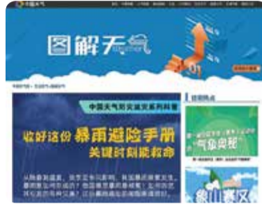
[그림=중국 기상청이 제작한 폭우 대피 안내서]

호우 예보가 있으면 저지대나 상습 침수지역에 거주하고 있는 주민들은 대피를 준비해야 한다. 대피장소와 비상 연락 방법을 미리 알아두는 것이 좋다. 중국 기상청 홈페이지에서 폭우와 홍수 대피 안내서를 찾아볼 수 있다.