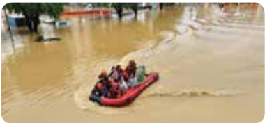
[사진= 구조대원이 홍수 속에서 사람들을 구조하는 모습]

올여름, 홍수 사고에 미리 대비해야 할 때다. 중국 응급관리부에 따르면 지난해에만 35차례 폭우가 발생했다. 총 5,278만 9000명이 다양한 재해를 겪었으며 이로 인한 사망자와 실종자는 309명이다. 최근 중국에서는 폭우와 홍수로 인한 피해가 심각한 상황이다. 매년 중국에서는 폭우로 인해 수천 명의 사상자가 발생하고 경제적 손실은 수십억 위안이다. 폭우와 홍수로 인한 피해는 예상치 못한 순간에 발생할 수 있으므로 이를 사전에 대비할 필요가 있다.