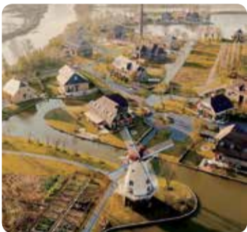
大龙岛湖岸·若里度假村

지난해 신규 오픈한 호텔로 장쑤성 염청(盐城) 더우룽강(斗龙港) 관광 리조트 내에 자리 잡고 있다. 호텔에서 800미터 거리의 염청 대표 관광지 네덜란드 꽃의 바다에는 3000만 그루 이상의 튜립이 장관을 이루고 있어 특히 봄철에 가기 좋다. 이 밖에 '도시의 허파'라 불리는 웨이원룽완(水韵龙湾) 삼림공원도 호텔 가까운 곳에 위치해 있다. 리조트 내부에는 수상 보트, 미니 축구장, 놀이공원, 사이클링 등 다양한 오락 시설이 있다. 호텔 객실은 총 101개로 이중 별장식 스위트룸 37개는 호숫가에 자리 잡았다.