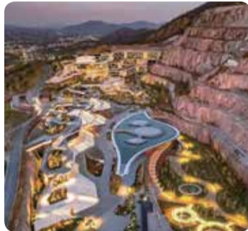
宜兴龙隐溪山酒店

'보배 휴양지'로 꼽히는 이상의 야다양셴시산(雅达·阳羨溪山)은 숙박, 식사, 놀이 등을 한 곳에서 모두 즐길 수 있는 휴양 마을이다. 주변에는 GOA 코끼리 디자인의 야다극장, 야다 문화예술센터, 호숫가 공원 등도 자리 잡고 있다. 마을 입구에서 방문객들을 반기는 룡인시산 호텔은 양셴호(阳羨湖)를 마주하고 동포각(东坡阁)을 등지는 최고의 위치를 자랑한다. 호텔 객실은