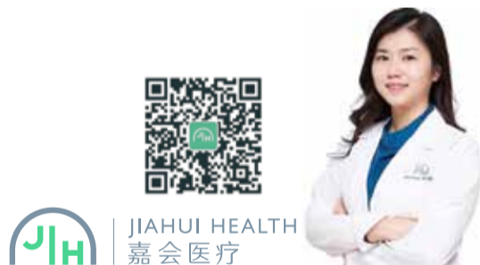
JIAHUI HEALTH 嘉会医疗

치주진료는 단발성으로 끝나는 것이 아니라 꾸준한 관리가 필요한 질병이다. 3-6개월 정기적인 구강검진과 스케일링으로 치주질환을 예방할 수 있다.